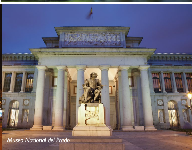
Museo Nacional del Prado