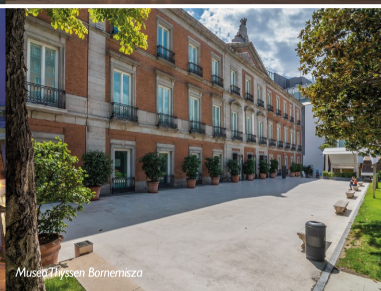
Museo Thyssen Bornemisza