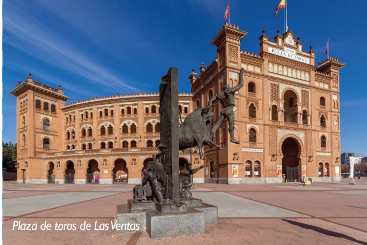
Plaza de toros de Las Ventas