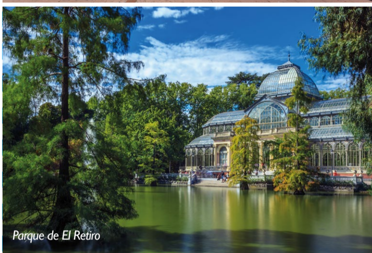
Parque de El Retiro