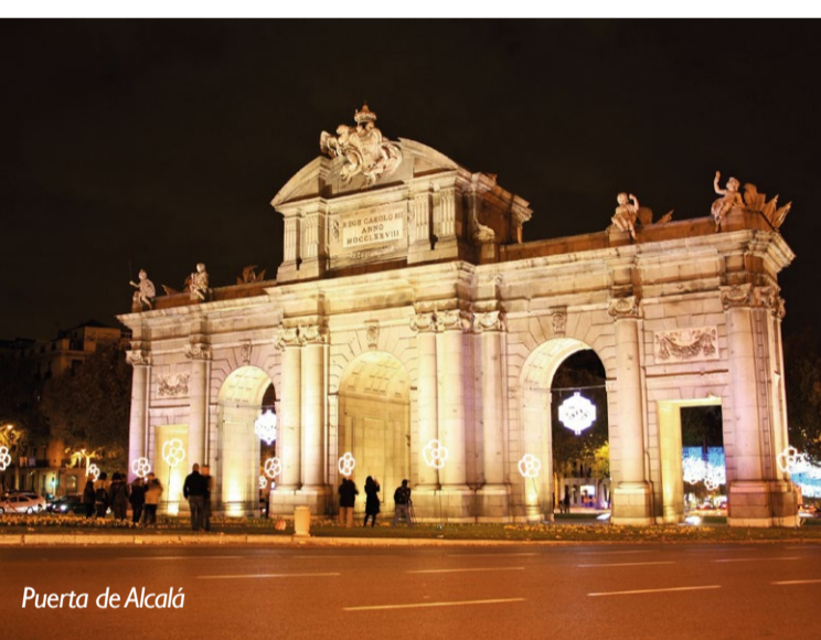
Puerta de Alcalá