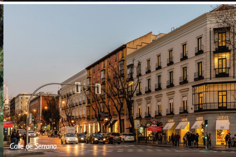
Calle de Serrano